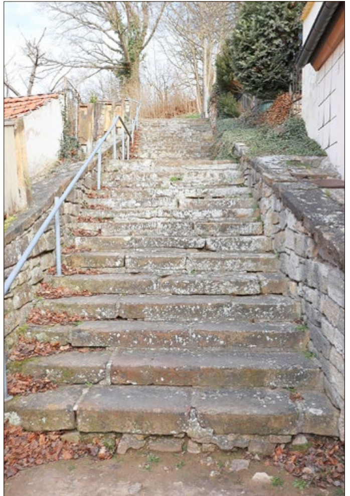
Drei Objekte sollen vordergründig in Creuzburg im Rahmen der Stadtkernsanierung in Ordnung gebracht werden: Die Treppen und Mauern am Alten Friedhof,...

Der Beginn der Sanierung der Mauern und Treppenanlagen am Alten Friedhof, die Sanierung des romanischen Hauses „Kloster“ am Plan und die Sanierung des Stadtmauerturmes am Grundstück der Creuzburger Grundschule.