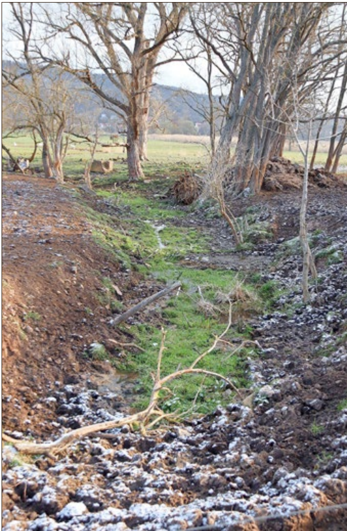
Reste des einstigen Flossgrabens.

Trotz eines optimistischen Beginns der Sanierung der Saline verlief der weitere Ausbau nur wenig erfolgreich. Georg von Harstall ließ einen erheblichen Aufwand betreiben. Mitunter waren täglich bis zu 20 Personen beschäftigt. Als dann nach viel Mühe eine spärliche Salzproduktion begonnen werden konnte, verhinderten die politischen Umstände, vor allem der Verlust der Kurwürde im Schmalkaldischen Krieg, einen anhaltenden Erfolg.