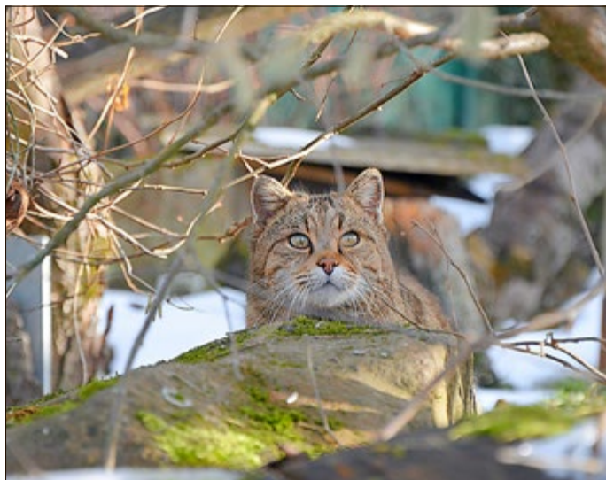
Kater Carlo wartet auf sein Frühstück

Betrieben wird das BUND Wildkatzenland Hütscheroda gemeinsam vom BUND Thüringen, der Gemeinde Hørselberg-Hainich, der Verwaltungsgemeinschaft Hainich-Werratal und der GEN e.V. (Förderverein Nationalpark). Im ganzen Dorf geht's um die Katz: ob lehrreich in der Wildkatzenscheune (Ausstellung), live auf der Wildkatzenlichtung (Gehege) oder im neuen Luchsquartier.