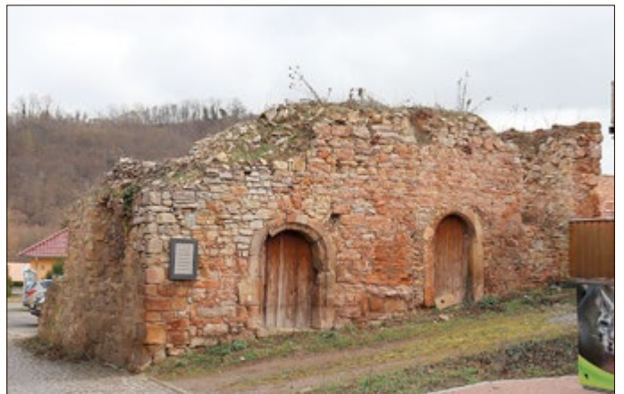
...das „Romanische Haus“ (Kloster) am Plan sowie...