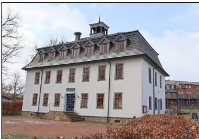
Das Stiftsgut Wilhelmgücksbrunn, Zentrum der früheren Saline, heute.

Auch die bekannte Liboriuskapelle dürfte mit diesen Salzquellen in Zusammenhang zu sehen sein. Liborius galt u.a. als Schutzheiliger der Steinleidenden und galt auch als Schutzherr der Salzquellen, deren heilsames Salzwasser bereits damals zur Linderung der Leiden genutzt wurde. Als Wallfahrtskapelle weithin berühmt ging es den Menschen, die sie damals aufsuchten, sicher nicht nur um den Ablass, sondern auch um die Wirkung des Wassers.