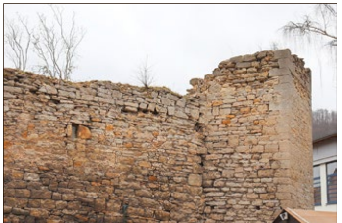
... der Stadtmauerturm an der Grundschule.