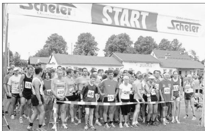
Start des Hainichlaufs 2019 in Mihla.