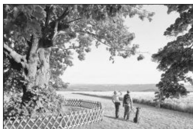
An der Lindenhecke

Anmeldungen zum BürgermeisterWandern werden gerne entgegen genommen unter 0361 573915010.