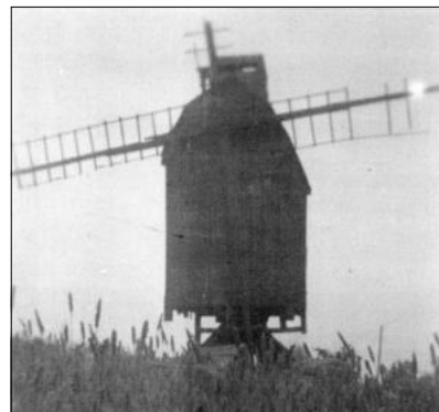
Eine der letzten Aufnahmen der bis 1950 existierenden Scherbdaer Bockwindmühle. Gut erkennbar ist der auf dem Dach errichtete Beobachtungsstand der sowjetischen Besatzungstruppen.