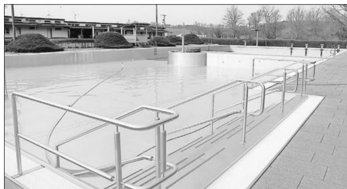
Direkt vor Ostern: Die Becken werden gerade abgelassen und dabei gesäubert.