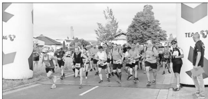
Start zum 2. Werratalmarathon 2021 in Treffurt.

der dabei notwendige Einsatz schwerer Technik viele der traditionellen Laufwege in Mitleidenschaft gebracht. Mehrfach waren die Läufer mit den Verantwortlichen von Thüringen-Forst und den Bauhofmitarbeitern bereits unterwegs, alles wird nicht so in Ordnung sein wie in den letzten Jahren. Daher müssen wohl auch kleinere Abschnitte der Laufstrecken umgelegt werden.