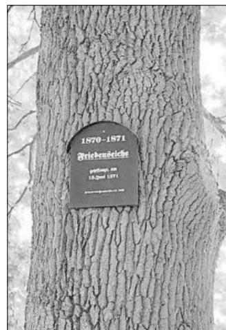
Die 1871 gepflanzte „Friedenseiche“

Bekannt wurde er vor allem durch sein soziales Engagement. Seine Stiftung, die Carl Grübel Stiftung, beschäftigte sich vor allem mit der Förderung des traditionellen Handwerks, wobei dies ausdrücklich auch auf die dörfliche Situation