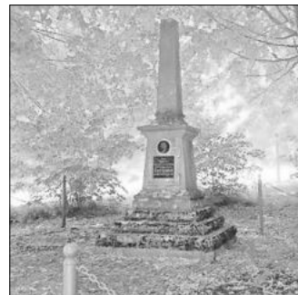
Das Denkmal im Jahre 2022