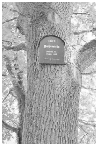
Die „Kaisereiche“ von 1913

im Herzogtum abgestellt war. So verdankt unsere Region dieser Stiftung und dem damit verbundenen Handwerker-Verein die Förderung des Weberhandwerkes, besonders in den Gothaer Orten Nazza und Frankenroda.