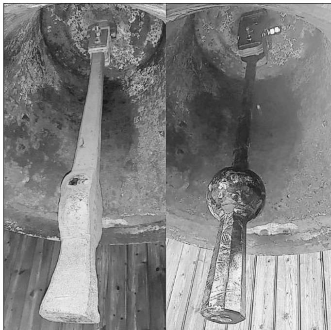
Der alte Flachballen-Klöppel (links) und der neue Rundballen-Klöppel (rechts) im Vergleich

Allerdings entschied sich der Gemeindekirchenrat doch für die Anfertigung eines neuen Klöpfels, denn auch wenn der alte keine Gefahr darstellt, verursachte er doch erhöhte Abnutzungsspuren in der Glocke. Die hierfür benötigten finanziellen Mittel wurden dafür im Haushalt eingestellt.