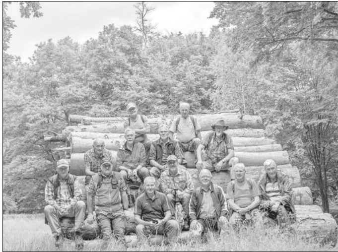
Männerpirsch am 09.06.2022