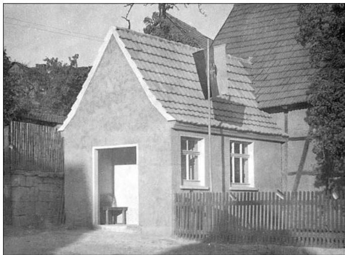
Neues Buswartehäuschen an der Ecke Schloßstraße/ Angerstraße, fertiggestellt im Sommer 1960[11].