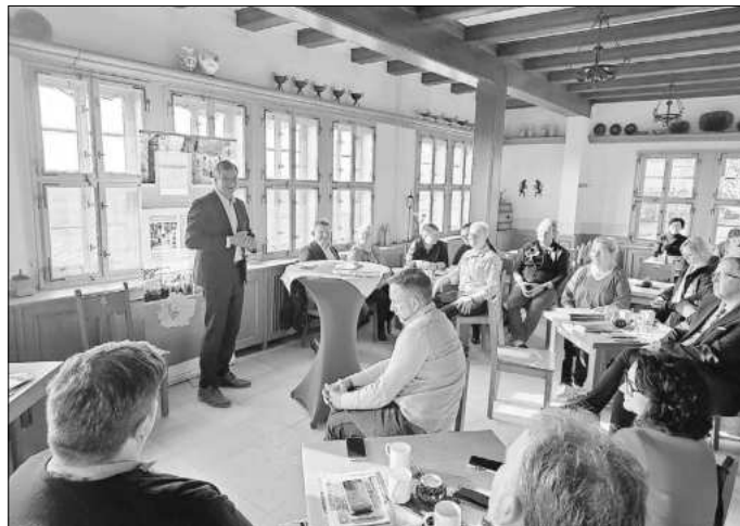
Präsentation durch Staatssekretär Feller

Der touristische Dachverband Welterberegion Wartburg Hainich e.V. darf sich über Fördermittel aus dem Thüringer Ministerium für Wirtschaft, Wissenschaft und Digitale Gesellschaft freuen. Insgesamt wurden für die Jahre 2024 und 2025 Fördermittel in Form einer Festbetragsfinanzierung in Höhe von 600.000 € bewilligt und dienen der Durchführung des Projekts „Regionales Tourismusmanagement im Verbandsgebiet des Welterberegion Wartburg Hainich e.V.“. Diese Summe ermöglicht es dem Verband, die bestehenden Strukturen zu stärken und die Marketingaktivitäten für das gesamte Verbandsgebiet auszuweiten. Zur geladenen Veranstaltung im Restaurant „Burgcafé Gadem“ auf der Wartburg am 25.03.2024 erschienen insgesamt 22 Vertreter aus Politik, Wirtschaft und Tourismus. Unter den Anwesenden war auch Staatssekretär für Wirtschaft, Hochschulen, Tourismus und Digitales, Carsten Feller, der zum Abschluss den Zuwendungsbescheid überreichte.