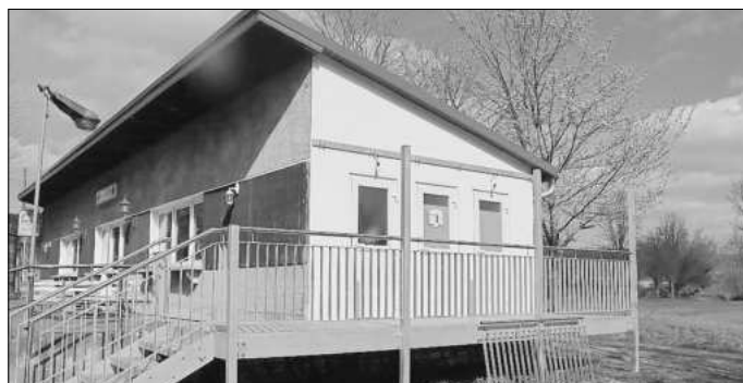
Blick auf die neue Toilettenanlage mit der verputzten Gebäudefront. Hier wird ein Terrassendach angebaut werden.

Eine immer wieder diskutierte Frage in Ebenshausen ist, wann die Bauarbeiten am Steg beginnen. Die Aufträge sind alle vergeben, die Baugenehmigung liegt vor. Nun muss die Stadt noch auf die Genehmigung der Wasserbehörde warten, da die Werra ein Fluss erster Ordnung ist und ein Eingriff wie die Arbeiten am Steg einen extra Bescheid erforderlich macht.