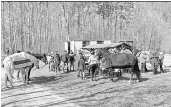
Gemütliches Beisammensein auf dem Holzplatz

Reit- und Fahrverein „Zur Gipsmühle“ Ifta e. V.