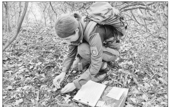
Projektleiterin Alisa Klamm sammelt Kotproben im Nationalpark Hainich.

ein Labor verschickt. So können Informationen bis auf Individuum-Ebene, beispielsweise die Bestimmung des Geschlechtes, gewonnen werden. Diese Ergebnisse werden dann statistisch ausgewertet, so dass Aussagen zum Bestand der Tierarten im Nationalpark möglich werden. Mit ersten Ergebnissen ist Ende des Jahres zu rechnen.