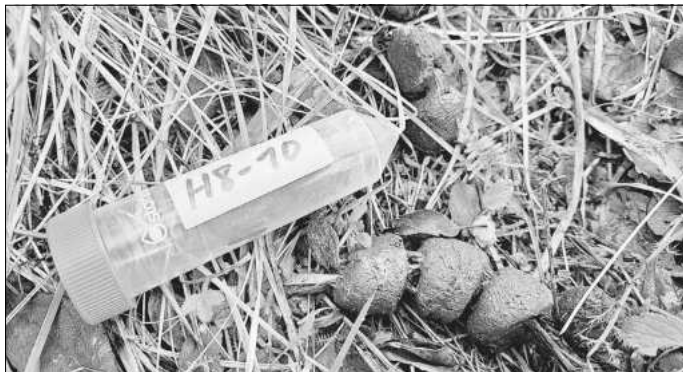
Die Kotproben werden mittels GPS verortet und in Röhrchen verpackt.