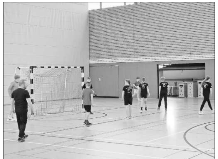
Die Freiwillige Feuerwehr Treffurt e.V.