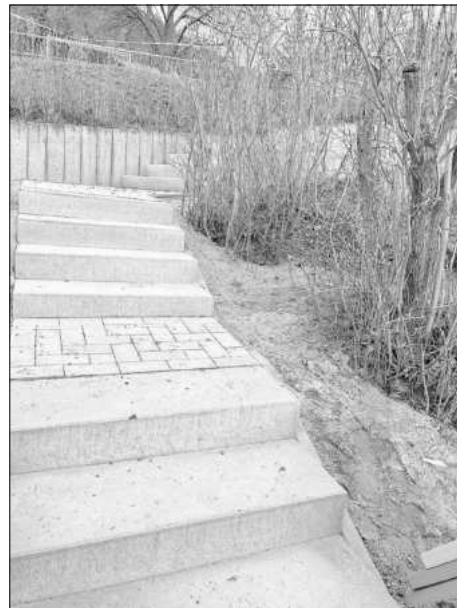
Treppe Kindergarten Falken

Der Bürgermeister berichtet über die laufenden Baumaßnahmen im Stadtgebiet.