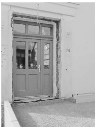
Eingebaut ist auch die neue Außentür.