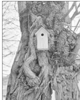
Anbringen des neuen Nistkastens. Bereit für den Einzug.