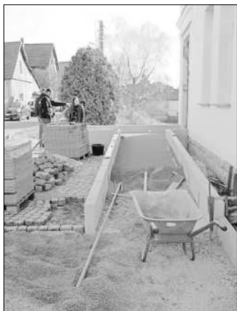
Blick auf den gerade errichteten barrierefreien Zugang zum Multihaus.

Die Stadt plant gemeinsam mit der Feuerwehr Scherbda Ende April einen Tag der offenen Tür zu organisieren, um die Ergebnisse der Umbauarbeiten öffentlich zu machen.