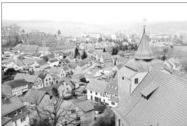
Blick über den Turm der Mihlaer St. Martinskirche auf den Ort, Aufnahme 2023.

Langsam wird die Landschaft grün. Neues Leben an den Bäumen, Sträuchern und Wiesen beginnt, die Frühlingsblumen bringen Farbe in unsere Orte.