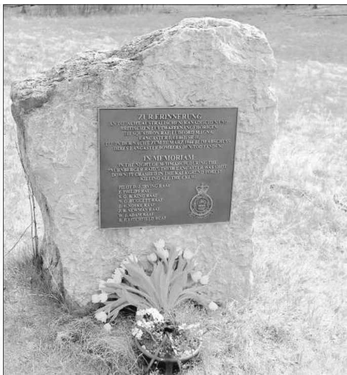
Der Gedenkstein mit den Namen der acht Gefallenen.