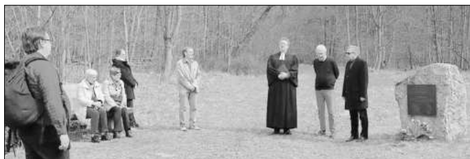
Während der Gedenkfeier im Kalkgrund.

Kriege und Krisen deutlich machen, dass die Menschen nicht aus ihrer Geschichte lernen können oder wollen, das Wissen und die Erinnerung an die damaligen Opfer auf beiden Seiten, bei der britischen Luftwaffe und der deutschen Zivilbevölkerung, nicht verlorengeht.