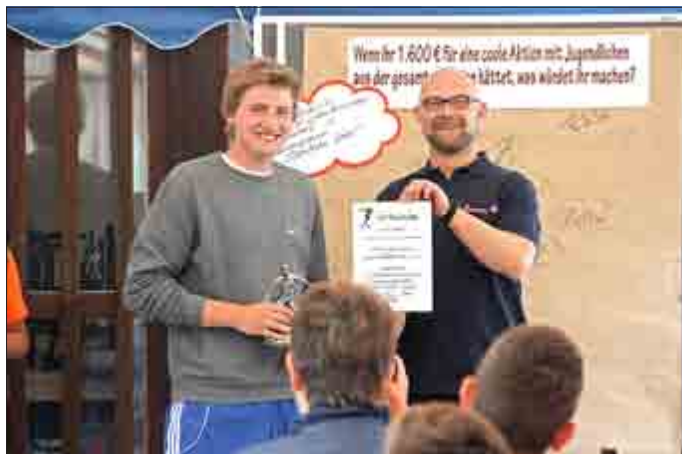
Stahlender Sieger nimmt den Pokal für den Jugendclub Ütteroda entgegen.