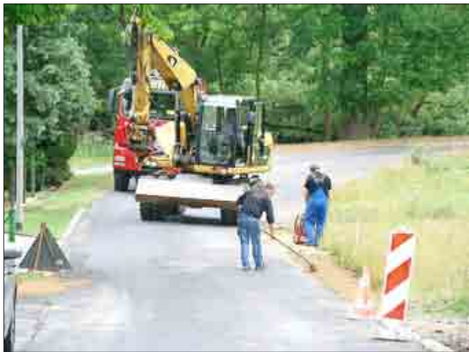
Von Mitarbeitern der Firma Beisheim wird die Werrastraße mit neuen Banketten versehen.