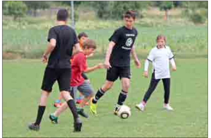
Das Kinderteam aus Ütteroda lässt sich nicht unterkriegen.