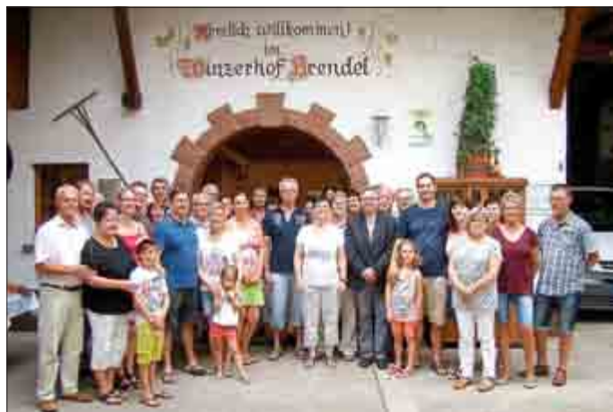
Gruppenfoto aller Teilnehmer im Winzerhof Brendel.

In den letzten Kriegswochen fanden schwere Kämpfe statt, bei denen noch hunderte Soldaten auf beiden Seiten fielen. Die Gemeinde Oberotterbach hat einen Geschichtslehrpfad aufgebaut, der an insgesamt 32 Resten der Westwallbunker entlang führt.