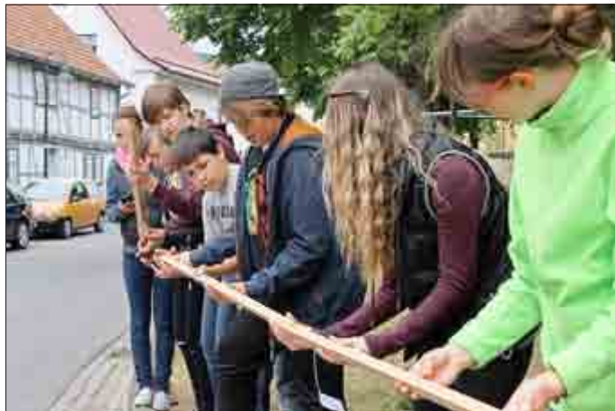
Konficup in Falken

Großburschla - Falken - Schnellmannshausen - Treffurt