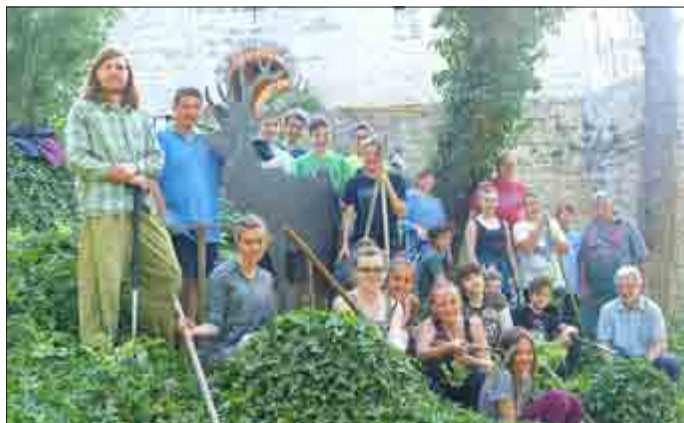
Alle Mitwirkenden vor dem Hirsch am Beginn des Pfades