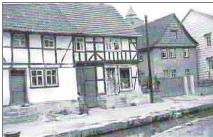
Die gleiche Perspektive - nur 80 Jahre früher.

Die Gemeinde ist letztlich darüber froh, wenn Brachen und leer stehende Gebäude durch private Initiativen wieder bebaut und einer Nutzung zugeführt werden. Eine Verbesserung des Ortsbildes wird dadurch auf jeden Fall erreicht. Was bleibt sind alte Fotos wie nachfolgend zu sehen und die Erinnerung an das „alte Mihla“, das es so schon lange nicht mehr gibt.