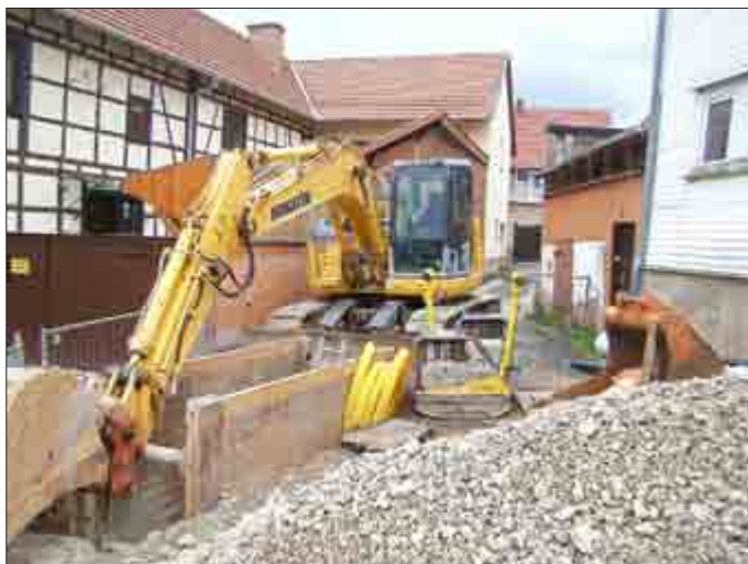
Bauarbeiten Auf dem Eisfeld

Dann ist allerdings auch das Schlimmste geschafft. Während der Kanalbau weiter bis zur Kita im Cuxhof voran getrieben wird, beginnen die Straßenbauarbeiten in der Dietzelgasse, die bei anhaltendem Bauwetter in diesem Jahr noch fertig gestellt werden soll.