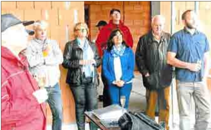
Aufmerksam verfolgen die Teilnehmer den Richtspruch

Aufmerksam folgten die Anwesenden der Ausführungen des Zimmermannes. Auf ein gutes Gelingen des Vorhabens wurde angestoßen.