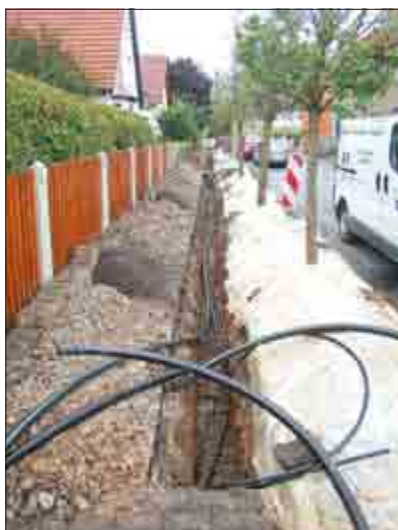
In der Rosenallee haben die Arbeiten an der Verlegung des Erdstromkabels begonnen.

Während die westliche Gehwegseite Am Cuxhof im Zuge dieser Baumaßnahmen mit einem teilweise neuen Gehweg, vor allem mehrere Hofeinfahrten werden neu gestaltet, zu Lasten der Gemeinde kommen wird, werden in der Rosenallee die Gehwege nur provisorisch wieder geschlossen. Die Gemeinde beabsichtigt, den Neubau des weitgehend kaputten südlichen Gehweges in den Haushalt 2016 aufzunehmen und grundhaft ausbauen zu lassen.